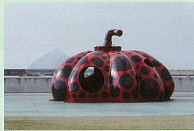
香川県/草間彌生「赤かぼちゃ」2006年直島・宮浦港緑地

豊かな自然 温暖な気候 やさしい人情 山海の幸。 人も風土もあったかい愛媛でスローライフを見つけませんか？