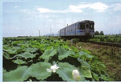
徳島県/れんこん畑

JR山手線・京浜東北線：有楽町駅（京橋口・中央口（銀座側）徒歩1分） 有楽町線：有楽町駅D8より徒歩1分 有楽町線：銀座一丁目駅2より徒歩1分 丸の内線：銀座駅C9より徒歩3分 銀座線：銀座駅C9より徒歩3分 日比谷線：銀座駅C9より徒歩8分 千代田線：日比谷駅D8より徒歩8分 都営三田線：日比谷駅D8より徒歩8分