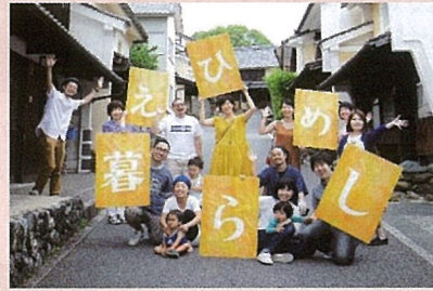
愛媛県/満喫！えひめ暮らし

美しい海と豊かな山がすぐそばにあります。近隣都市にも行きやすいのが魅力です。環境はもちろん、支援制度の充実で子育てのしやすい町が多数あります。野菜が魚が驚くほど新鮮でおいしいのです。生産者の顔が見え、地産地消を地で行くのがとくしまです。